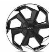
Жеңіл қорытпалы дискілер 19"