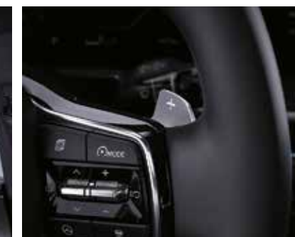
Рульдің астындағы берілістерді ауыстырып-қосу «жапырақшалары»