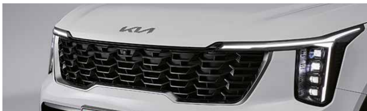
Қара жылтырмен әрленген радиатор торы