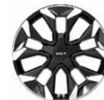
Жеңіл қорытпалы дискілер 20"