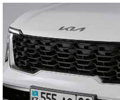
Радиатордың қара торы