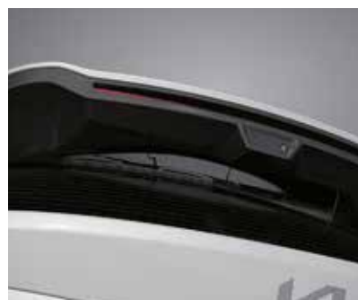
Артқы әйнектегі жасырын әйнек тазалағыш