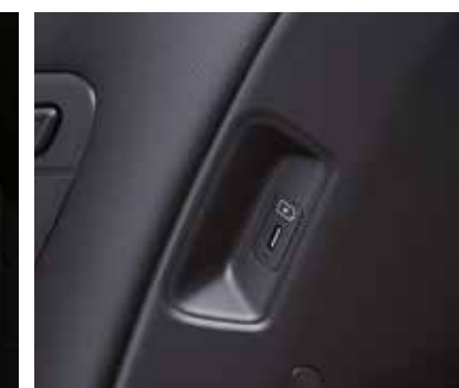
Бірінші қатардағы орындықтардың артқы жағындағы қосымша USB қуат беру құрылғылары