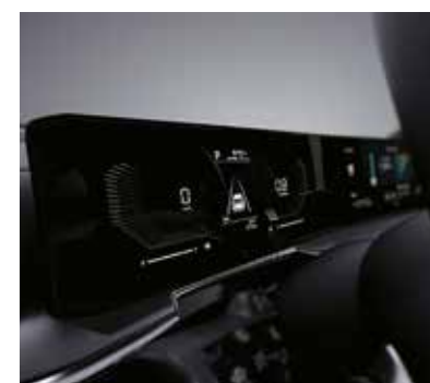
Supervision 4.2" аспаптар панелі