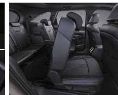
Түймешені басу арқылы екінші қатарға оңай кіру жүйесі