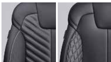
Тірісі бар Nappa сұрыпты былғары