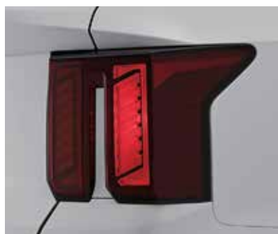
Қарапайым артқы фаралар