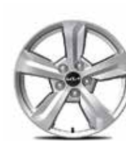
Жеңіл қорытпалы дискілер 17"