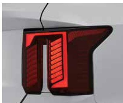
Жарықдиодты артқы шамдар