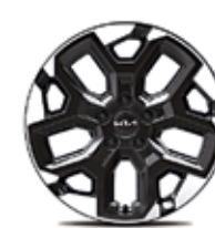
Жеңіл қорытпалы дискілер 18"